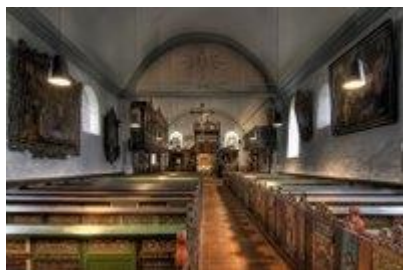
Långhuset med kyrkbänkarna