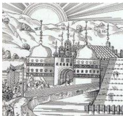
Det yttre "Mühlenlor" i Lübeck, så som det visas i "Lübeck, utsikt över Staden" av Elias Diebel år 1552