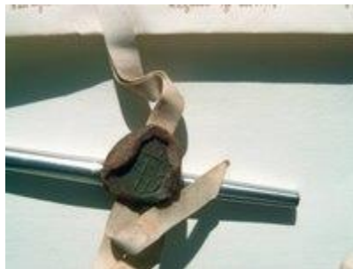
Sigill med vapen från urkunden 1455