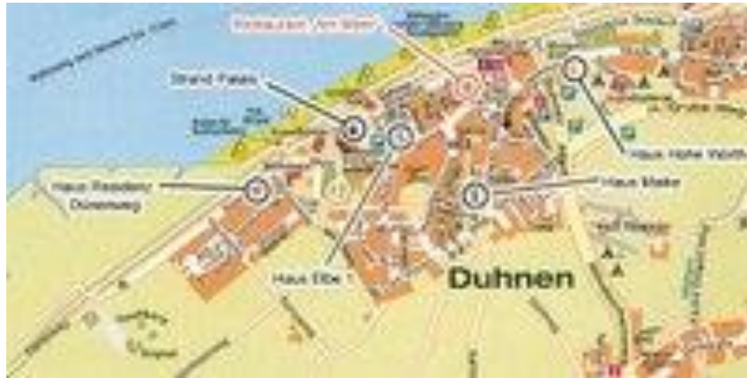
Duhnen i Cuxhaven, till vänster nedanför hillfort