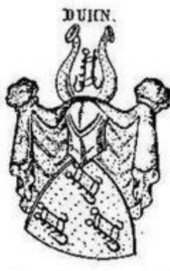
Emblem från det 18:e Århundradet