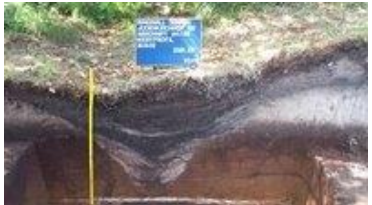
Utgrävning år 2002