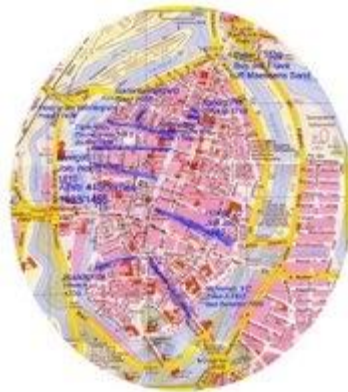
Karta över staden Lübeck med von Duhns olika bostäder