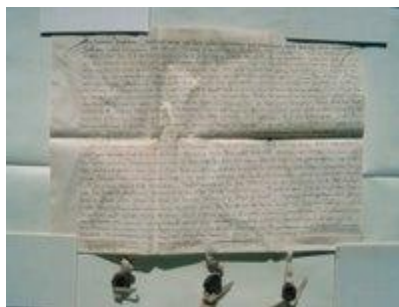
Certifikat för Urfehede Sörries v. Duhn mot hertigen av Mecklenburg, 1455