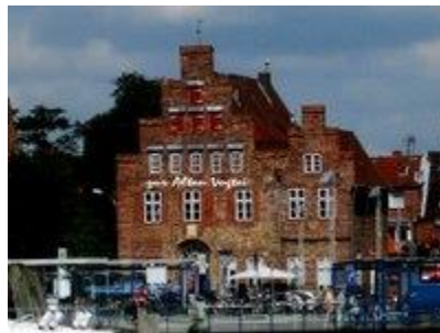
Det gamla fogderiet i Travemünde med sin renässans takmålningar - idag Café

1793, klagomål av skatteindrivare von Duhn (vilken?) på Mühlenort på grund av att främlingar fört bort en resväska med pengar. 1793 (3043. Berg Driver, Lübeck).