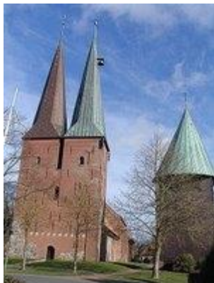
Bauerdomen i Altenbruch med sina tvillingtorn användes som sjömärke

Runt 1200 påbörjades byggandet av Bauerdomen i Altenbruch. Regionen Hadeln var under medeltiden till stor del en självstyrande region. Suveräna var de 7 samhällena Schuleissen och deras jury.