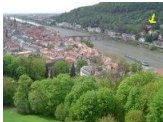
Heidelberg, Werrgasse 7