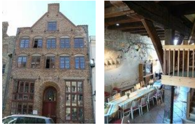
Rotbrau huset, Engelsgrube 47, ute och inne